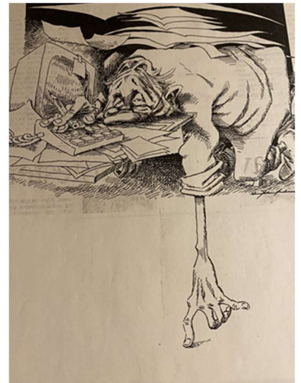
Til orientering ser vår skattmester heldigvis mye bedre ut!

Tallene vitner om solid arbeid og god økonomi.