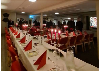
Orden på borddekorasjonene, og førnøyde brødre.

Julemøtet gav en fin avrundning av året. Seremonien i sal er enkel og stilfull, og gir mening. Ettermøtet med god bevertning og hyggelig samvær setter en god stemning blant Logebrødrene. Vi er klare for jul!