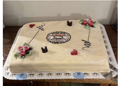
Bløtkaken fra Bergshaven var knallgod, da Ola Lode fikk sin 50 års-medalje.