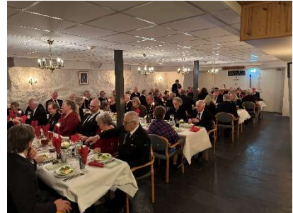
God stemning i festpyntet spisesal