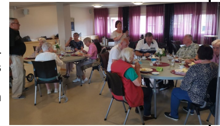
God stemning rund bordene.

Enda et vellykket arrangement. Mandag 27. mai inviterte vi, sammen med rebekkaloge 73 Magdalene, dagpasienter på Ladesletta Helse og Velferdssenter til vårens hyggetreff i logesalen Cici-gnon. Gjestene kom med taxi i tolvtida, og de fremmøtte søstre og brødre sørget for at gjestene kom trygt fra garderoben og opp i spisesalen hvor rebekkasøstre hadde pyntet lekre bord. Etter gjestenes ønske snudde vi på programmet i år og startet med kaffe og kake rett etter at gjestene kom. Etter kaffen ble det så servert biff Stroganof, noe som gjestene tydeligvis satte pris på. Under måltidet sørget Televimsen for stemningsfull taffelmusikk, og etterpå var det også noen som fikk seg en etterlengtet dans. Det var god stemning rundt bordene, så det var tydelig at gjestene satte pris på arrangementet. Det var mange som ga uttrykk for at de trivdes. Tida gikk så alt for fort, og snart var hyggestunda over, og