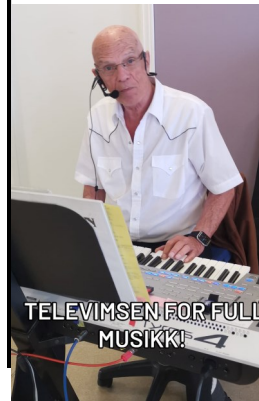
TELEVIMSEN FOR FULL MUSIKKI!

taxiene rullet opp for å ta med seg gjestene våre til sine respektive hjem. Om et halvt år er det ny hyggekveld, så da håper jeg jeg at Undermester får enda bedre oppslutning enn denne gang, for vi kunne godt ha vært flere brødre, men sammen med søstre fra Magdalene gjorde de frammøtte sitt til at arrangementet ble vellykket. Etter denne hyggestunda kan jeg bli fristet til å vri litt på Arnulf Øverlands ord: "Det at du gleder en annen det er den største glede". Bildene nedenfor viser noe av det som foregikk, men den gode stemningen måtte oppleves!