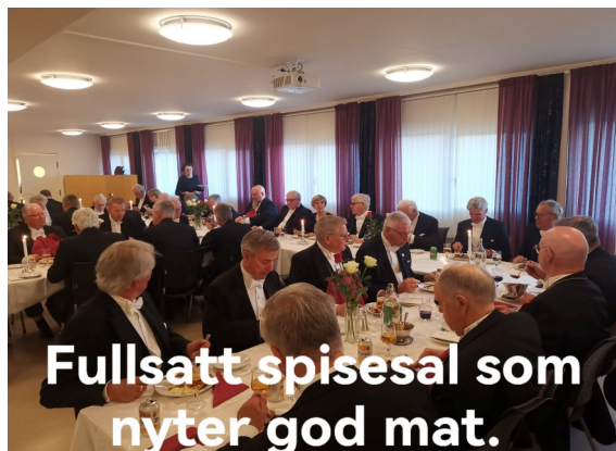
Fullsatt spisesal som nyter god mat.

Enda et vellykket arrangement. Mandag 27. mai inviterte vi, sammen med rebekkaloge 73 Magdalene, dagpasienter på Ladesletta Helse og Velferdssenter til vårens hyggetreff i logesalen Cici-gnon. Gjestene kom med taxi i tolvtida, og de fremmøtte søstre og brødre sørget for at gjestene kom trygt fra garderoben og opp i spisesalen hvor rebekkasøstre hadde pyntet lekre bord. Etter gjestenes ønske snudde vi på programmet i år og startet med kaffe og kake rett etter at gjestene kom. Etter kaffen ble det så servert biff Stroganof, noe som gjestene tydeligvis satte pris på. Under måltidet sørget Televimsen for stemningsfull taffelmusikk, og etterpå var det også noen som fikk seg en etterlengtet dans. Det var god stemning rundt bordene, så det var tydelig at gjestene satte pris på arrangementet. Det var mange som ga uttrykk for at de trivdes. Tida gikk så alt for fort, og snart var hyggestunda over, og