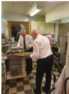
Stor mobilisering på kjøkkenet!