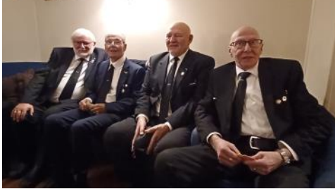
Glade brødre fra Alta, s.8

Nr. 3 Informasjonsorgan for Loge nr. 70 Kvitbjørn desember 2024