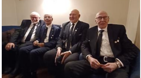
Fire glade brødre fra Alta.

Instruksjon er viktig og burde kanskje gjennomføres oftere.