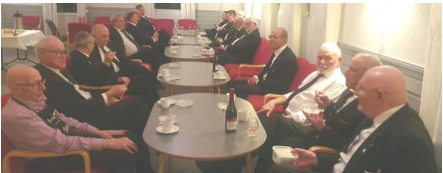
Hyggelig godt oppmøte av patriarkene!