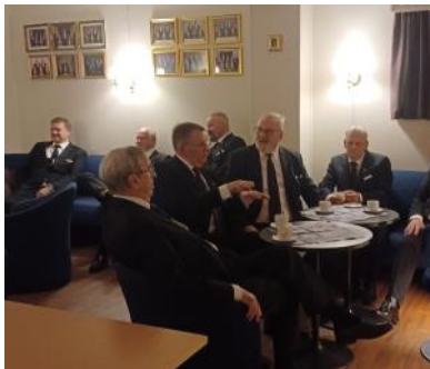
Praten går livlig

var avlyst. Den var flyttet til ut i februar 2025.