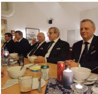
Mett og god?