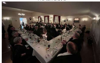
Fra taffelet 2

Det var mange på talerlisten og i tur og orden ble mange godord sakt om loge 135 Mærdø, som er distrikt 22 sin nest yngste Odd Fellow loge.