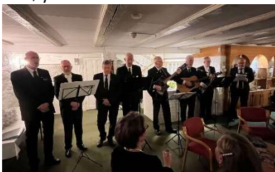
Østre Gab i aksjon

De fleste Odd Fellow logene i distrikt 22 var representert, det samme var de to leirene, 22 Aust-Agder og 27 Homborside. Aftenen startet med Festloge med ledsagere og ritualet ble gjennomført på høytidelig og flott måte. Programmet fortsatte i kjellerstuen, hvor Chantikoret ØSTRE GAB, bestående av medlemmer fra de tre Odd Fellow logene i Arendal, underholdt gjestene til stor glede og fornøyelse.