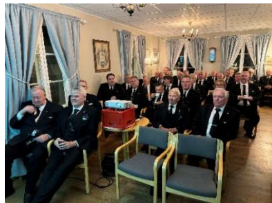
Brødrene satt helt stille og fulgte godt med