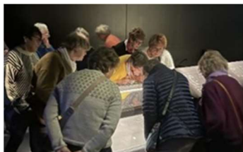
Full konsentrasjon om Slemmedalskatten

Nevnd for styrkelse og ekspansjon inviterte til høsttur for å se utstillingen om Slemmedalskatten. 20 søstre fikk en levende fortelling om skattefunnet, hyggelig samvær og måltid på museet. Arrangert til inntekt for søsterfondet.