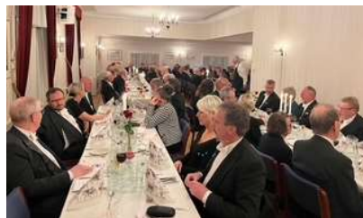
Fra taffelet 1

Presis kl. 19.30 gikk vi til bords og fikk servert et nydelig festmåltid bestående av helstekt indrefilet av okse, hasselback poteter med grønnsaker og sitron-fromasj med krem og bringebærsaus til dessert, servert av fire brødre fra loge 61 Terje Vigen og fire brødre fra loge 107 Torungen.