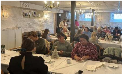
Full konsentrasjon i engle-makeriet