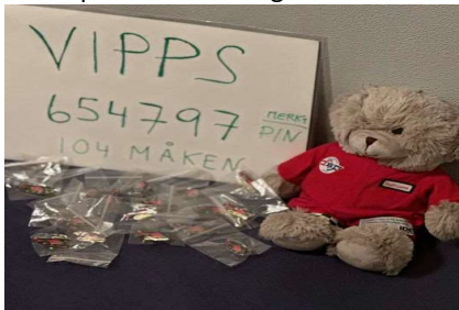
Piloten Luffe selger pins for kr 100,-

Vi startet i april 2024 med en prosjektgruppe hvor det ble lansert mange gode ideer. Kontaktperson samarbeider med embetskollegiet og står for planlegging og gjennomføring av ideene, sammen med søstrene i logen. Vi har i skrivende stund fått inn i overkant av kr. 31.000, - som resultat av lotterier, pinssalg, hobbydag og mimrekveld, noe som betyr at vi er i rute for å nå 104 Måkens mål. Søstrene vil fortsette med å arbeide i det godes tjeneste både sentralt og lokalt, for å realisere våre verdier og omsette ordenens etikk i praktisk handling.