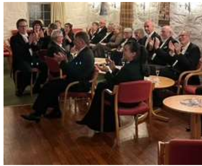
Publikum koste seg med Østre Gab

Presis kl. 19.30 gikk vi til bords og fikk servert et nydelig festmåltid bestående av helstekt indrefilet av okse, hasselback poteter med grønnsaker og sitron-fromasj med krem og bringebærsaus til dessert, servert av fire brødre fra loge 61 Terje Vigen og fire brødre fra loge 107 Torungen.