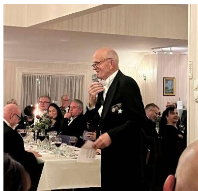
En av talerne

Det var mange på talerlisten og i tur og orden ble mange godord sakt om loge 135 Mærdø, som er distrikt 22 sin nest yngste Odd Fellow loge.