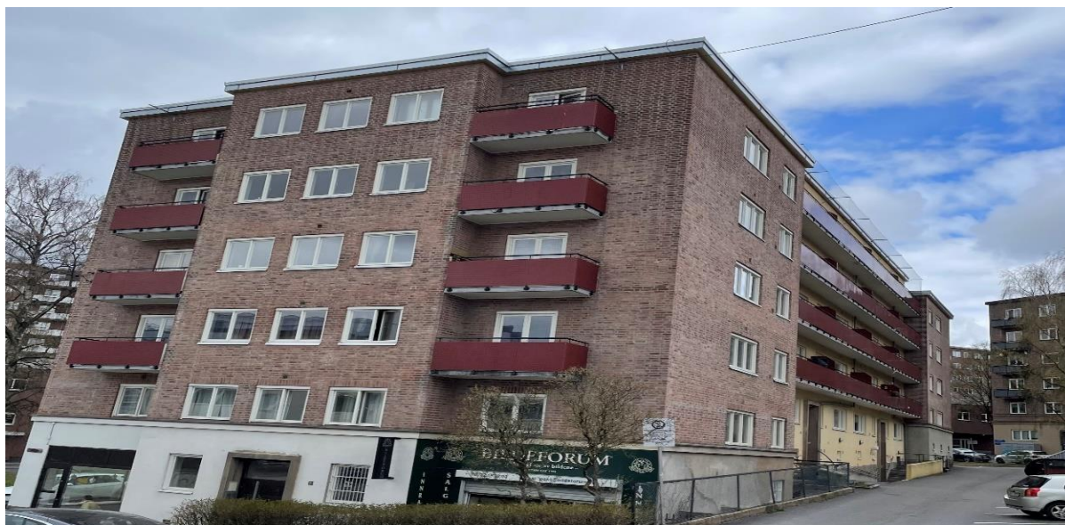
Sinsenveien 6 – 12

Ved opprettelse av stiftelsen og overtagelse av Sinsenveien 6-12 i 1974 var bygget og leilighetene godt vedlikeholdt, men etter hvert som årene gikk ble slitasjen stor og flere større prosjekt, slik som bytte av tak, vinduer og dører samt røropplegg, sto for tur. Dette gjorde at det ble utfordrende å få dette til å gi nødvendig avkastning. Når det samtidig også utviklet seg slik at stadig færre ordensmedlemmer var beboere, snek tanken seg inn om at en ny kurs måtte stakes ut. Det var, og er, jo også slik at å drive virksomhet av denne type ikke er noe Ordenen skal beskjeftige seg med.