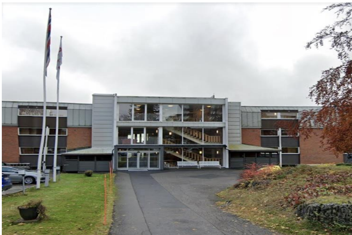
Odd Fellow Seniorboliger. Folke Bernadottes vei

Dette praktbygget i Folke Bernadottes vei har stått her siden det ble ferdigstilt i 1963 og senere opp gjennom årene utvidet på forskjellige måter. Dette finnes beskrevet i det jubileumsskrivet som ble utgitt i 2013 da Odd Fellow Seniorboliger rundet 50 år.