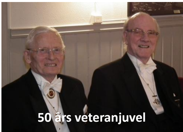
50 års veteranjuvel