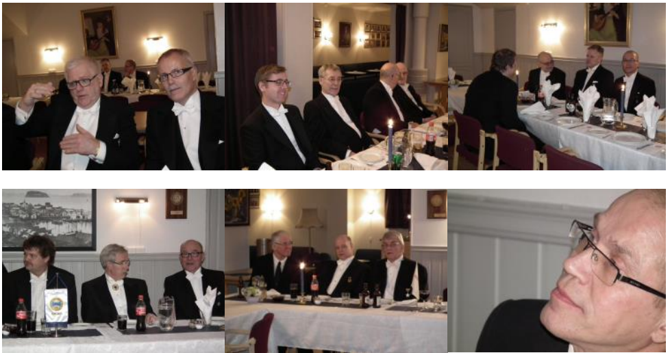
Red.: Fred Davidsen