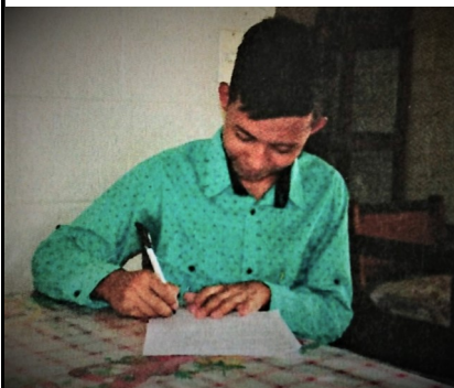
Her jobbes det med leksene