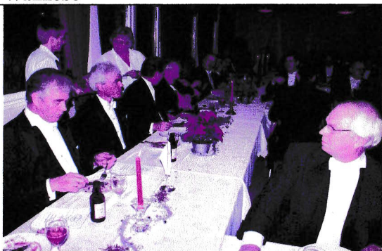
Blide gjester rundt bordet.