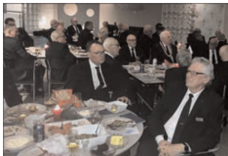
Her ser vi et bord med rakefisk og tilbehør

Selv om det blir noen timers kjøring så er det en bagatell i forhold til opplevelsen.