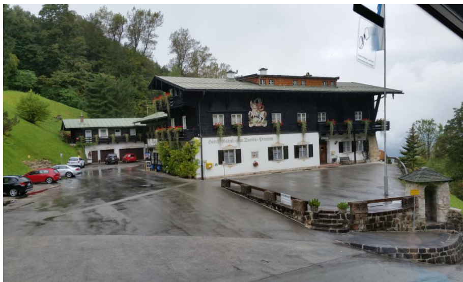
Hotell Turken med inngang til tunnelsystemet.

Vi kjørte buss opp til dokumentasjonssenteret hvor omvisningen startet. Etterpå gikk vi over til restene av Berghof. Rundt Berghof hadde mange av toppene i nazipartiet sine egne feriesteder, og disse var knyttet sammen i et tunnelsystem. I tillegg var det sprengt inn rom og haller i fjellet som fungerte som tilfluktsrom, sykestuer og innendørs skytebane for vaktmannskapene som passet på partitoppene. På siden av Berghof ligger hotell Turken hvor inngangen til bunkeranlegget er. Vi fikk en omvisning nede i anlegget hvor det ble bygd flerfoldige kilometer med tunnel. Det som slo oss var at dette ble bygd over en kort periode på noen måneder i en tid med enklere utstyr enn i dag, og i tillegg var det krig. Vell nede igjen i Berchtesgaden ble det en matbit før vi reiste tilbake til München. Sett i ettertid hadde det vært fint å ha reist ned hit på sommeren med leiebil og vært her noen dager. Det er et flott område med fjell, sjøer og vintersportsarenaer som også er åpne om sommeren for omvisning, samt kort vei til Østerrike og Salzburg. Fra München er det ca. 2 timer med bil.