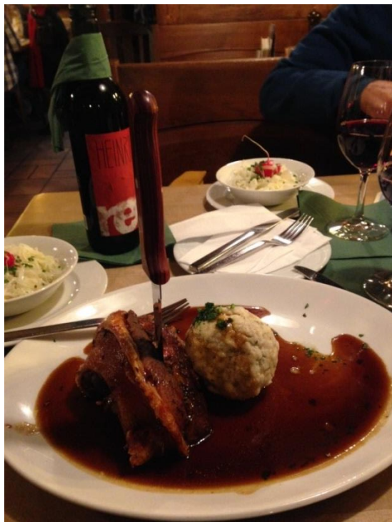
Schweinshaxe med tilbehør.

Til kvelden hadde vi forhåndsbestilt Schweinshaxe som krever langtidssteking ovnen. Med riktig tilbehør smakte det utmerket, og var en fin avslutning på en god tur!