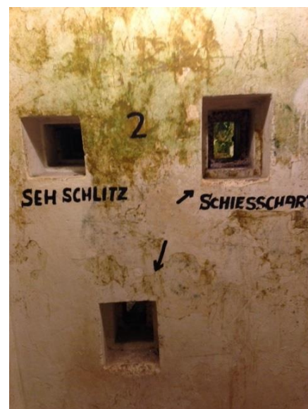
Skyteskår nede i bunkeranlegget