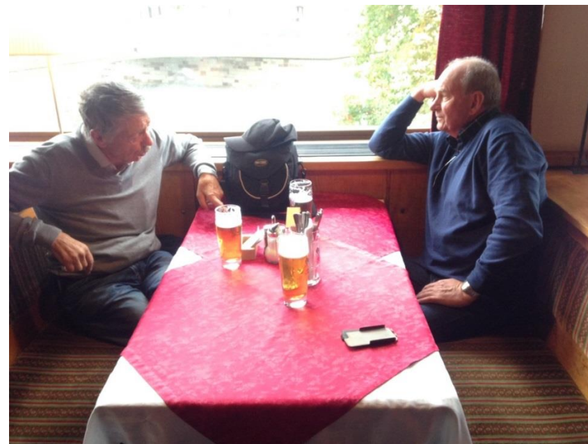
Lunsj i Berchtesgaden.

Som vanlig startet vi dagen med frokost i bakeriet før vi reiste ut til Berchtesgaden. Vi hadde på forhånd kjøpt togbillett, slik at det var bare å ta S-Bahn inn til sentralstasjon og finne toget til Salzburg. Turen tok ca. 3 timer. I Freilassing byttet vi til buss som korresponderte med toget. Her var det kaldt, og i løpet av natten hadde det kommet snø i høyden. Vi var klar over at turen opp til Ømeredet kunne bli avlyst på kort varsel i tilfelle snø. Som fryktet, så ble turen kansellert ettersom det var farlig å kjøre på den kronglete veien. Som erstatning fikk vi tilbud om en egen omvisning på Berghof, noe vi takket ja til. Vi rakk en bedre lunsj før omvisningen startet kl. 13.15.