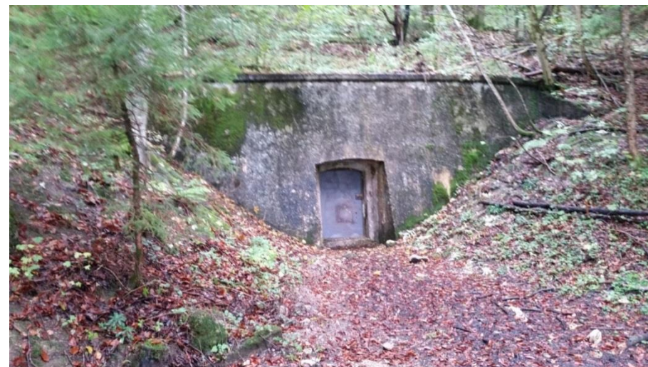
Utgang fra bunkeranlegget under Berghof.