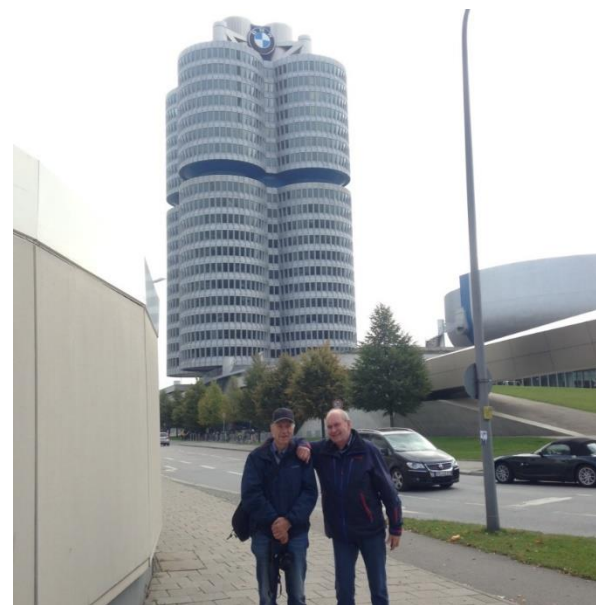
To glade gutter utenfor BMV Velt.

Vi startet neste dag med en god frokost i bakeriet før vi reiste med S-Bahn ut til Olympiastadion. Der ligger BMW Velt som består av BMW museet, en av BMW's fabrikker samt hovedkontoret til BMW. I museet er det mulighet til å se hva som er produsert opp igjennom tiden av ulike biler og motorsykler. Vi hadde planlagt besøket til den dagen med guidet omvisning inne i fabrikk. Omvisningen startet kl. 13, og vi hadde derfor god tid til å se museet først. Her er det en stor utstilling over flere etasjer, og som dekker de fleste modeller av biler og motorsykler. Mange fine eksemplarer som ikke er å se på veien lengre!