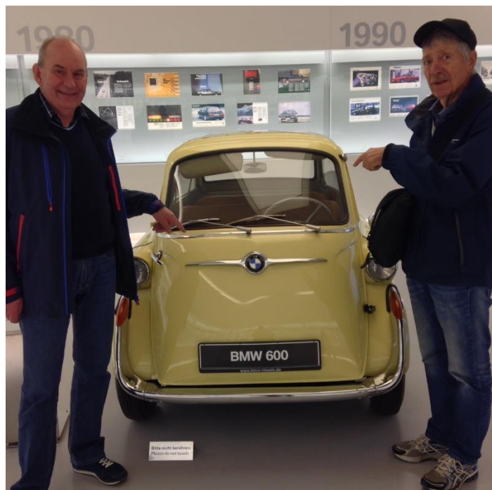
Små barn-små gleder

Det ble tid til en matbit før omvisningen begynte. Dessverre var ikke lov å ta bilder inne i produksjonslokalene. Rundturen startet hvor de ulike delene blir stanset ut med enorme presser. Neste trinn var sammensetting og sveising av karosseriet med presise roboter. Lakkeringen ble utført inne i egne haller hvor trykket var konstant for å gi en mest mulig jevn påføring. Etterpå ble alle resterende deler som en bil består av montert. Til slutt blir den ferdige bilen startet for første gang og prøvekjørt. Vi var veldig imponert over hva vi hadde sett! På kvelden ble det god mat på Obermaier. Vi fikk også bestilt schweinshaxe til torsdagskvelden.