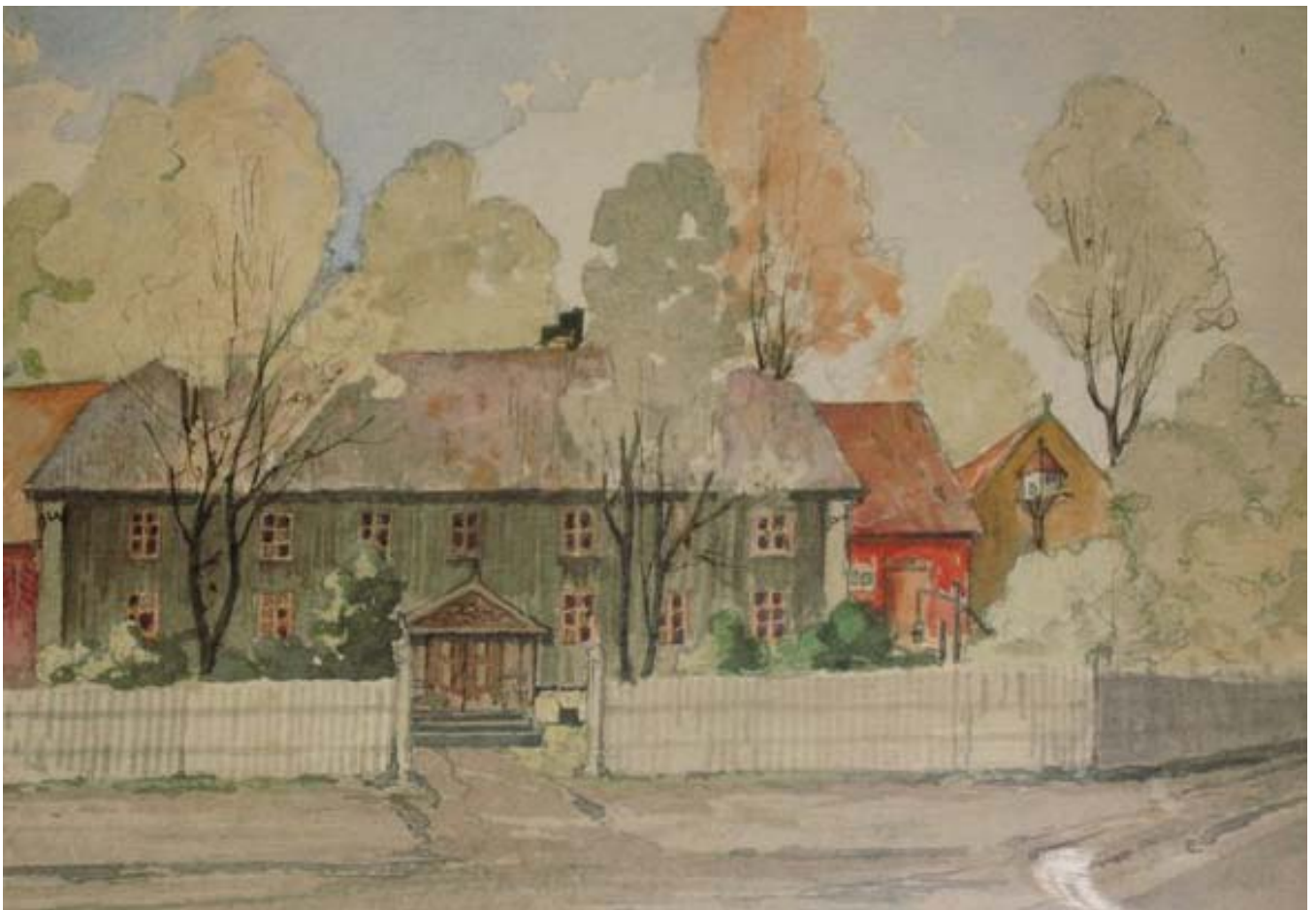
Bestefartomten med Bestefars restaurant