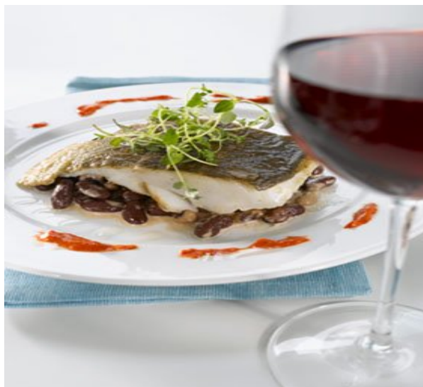
Skinnstekt torsk, som her, er en av utallige måter å tilberede fisken på

Den har lyst, delikat og magert fiskekjøtt som egner seg både til koking og steking. I Norge velger vi gjerne rødvin til kokt torsk. Vinen bør da være ueiket og ha moderat med tannin. En lett og fruktig Valpolicella eller Beaujolais egner seg godt, men du kan også bruke en saftig rødvin fra Bordeaux uten for mye tannin.